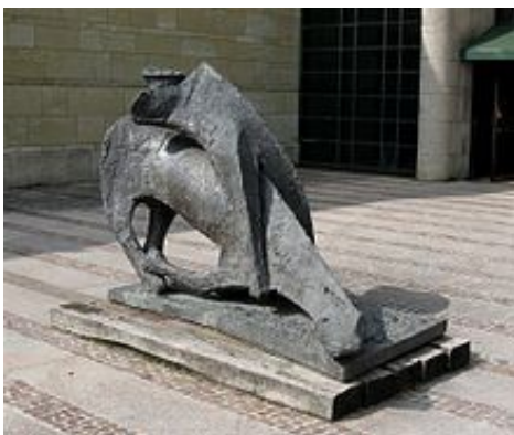
Marino Marini: Miracolo, 1959 /60 Neue Pinakothek, München.

Die anonymen Reiter Marinis sind nicht als Herrscher über das Pferd ausgeformt. Sie gehen durch farbige Fassungen und Oberflächenfakturen eine Einheit mit dem Tier ein. Sie scheinen ebenso zu stürzen wie das Pferd selber. In etlichen Arbeiten hat Marini dieses Thema nach Positionen von Balance und Ungleichgewicht ausgelotet und immer wieder neu interpretiert. Vor dem Hintergrund der Entwicklung des Faschismus unter Mussolini in Italien sind die Arbeiten Marinis als mutige Kritik an der sich verändernden Gesellschaft zu verstehen.