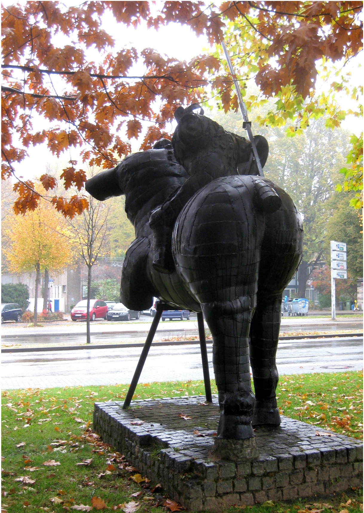
Aufnahmen vom Oktober 2012