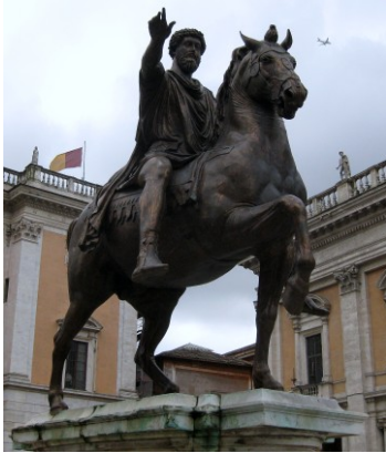
Reiterstandbild Marc Aurel, Rom, Kopie

In Deutschland zählt der Bamberger Reiter zu den bedeutenden Zeugnissen der Kunstgeschichte. Bereits im 12. Jahrhundert gab es beinahe lebensgroße Reiterstandbilder an den Fassaden gotischer Sakralbauten in Südfrankreich. Mit dem Bamberger Reiter im Inneren eines Gebäudes wird ein neuer Weg beschritten. Das Standbild ist zweifelslos einem geistig - spirituellen Bildprogramm verpflichtet. Da der Reiter eine Krone trägt, muss es sich um einen König und um einen Heiligen handeln, sonst hätte das Standbild nicht innerhalb des Doms errichtet werden dürfen. Damit erfährt das Reiterstandbild beinahe eine liturgische Qualität.