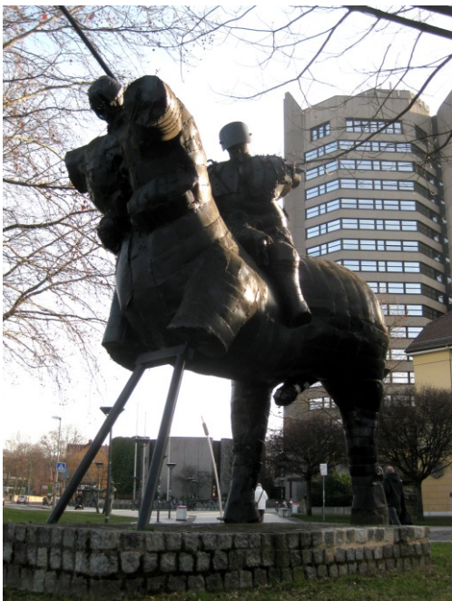
Doppelkentaure vor dem Neuen Rathaus

Ausgestattet mit dem Sinnbild großer Potenz ist das Mahnmal gegen Krieg und Gewalt eine Provokation, die eine durchaus beabsichtigte, langanhaltende Diskussion verursachte.