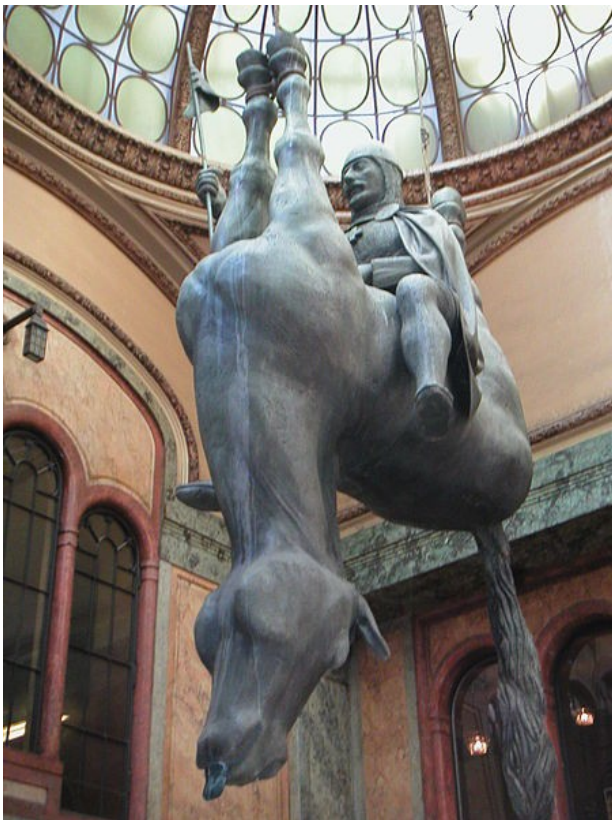
David Cerný. Der heilige Wenzel, Prag Aus: Wikipedia

Im Jahr 1999 schuf der tschechische Bildhauer David Cerný eine Parodie auf das Reiterstandbild des heiligen Wenzel auf dem Wenzelsplatz in Prag. In die Kuppel der Lucerna - Passage hängte er ein Pferd kopfüber an den Beinen auf, die Gestalt des Wenzels platzierte er auf den Bauch des Pferdes. Diese kritische Arbeit verweist mit künstlerischem Impetus auf das tschechische Volk, das von den Politikern im Laufe der Jahre "totgeritten" worden ist.