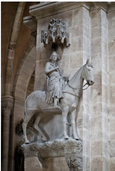
Bamberger Reiter, Höhe 2,33 Meter

In Deutschland zählt der Bamberger Reiter zu den bedeutenden Zeugnissen der Kunstgeschichte. Bereits im 12. Jahrhundert gab es beinahe lebensgroße Reiterstandbilder an den Fassaden gotischer Sakralbauten in Südfrankreich. Mit dem Bamberger Reiter im Inneren eines Gebäudes wird ein neuer Weg beschritten. Das Standbild ist zweifelslos einem geistig - spirituellen Bildprogramm verpflichtet. Da der Reiter eine Krone trägt, muss es sich um einen König und um einen Heiligen handeln, sonst hätte das Standbild nicht innerhalb des Doms errichtet werden dürfen. Damit erfährt das Reiterstandbild beinahe eine liturgische Qualität.