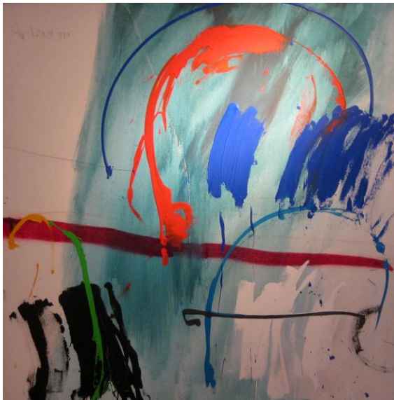
Aus dem Prometheus Zyklus