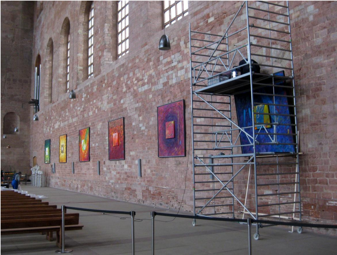
Ego Eimi. Die sieben Ich-bin-Worte. Alle 222x222cm. Eröffnet am 28. März 2015