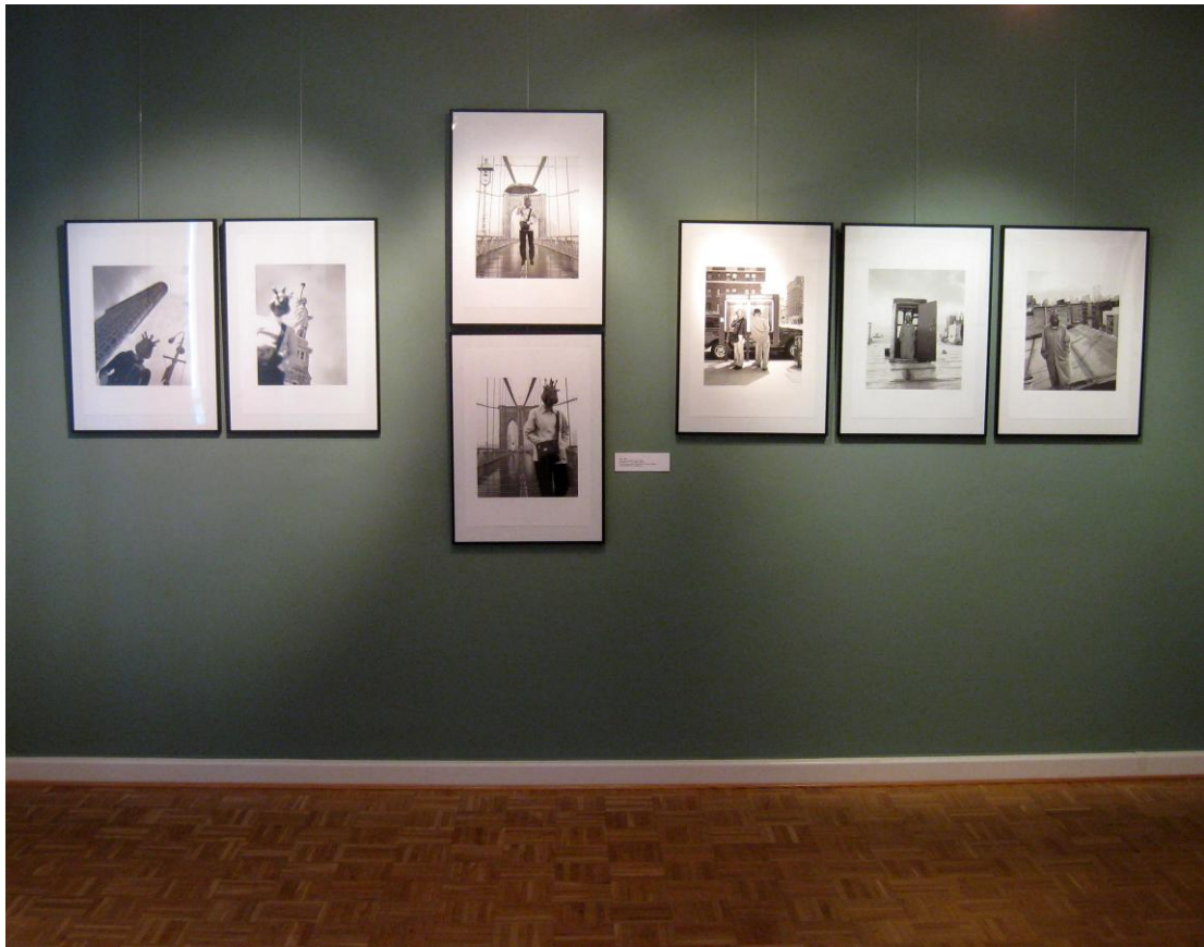
Olf Appold (1968): Beispiel New York Zyklus .

Insgesamt 25 Fotos aus verschiedenen Themenkreisen von DIN A 2 – 100 x 100cm