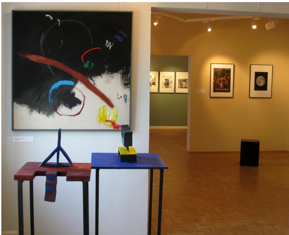
Stahlplastiken und Bild aus dem Prometheus-Zyklus von Uwe Appold (1942)

Insgesamt 25 Fotos aus verschiedenen Themenkreisen von DIN A 2 – 100 x 100cm