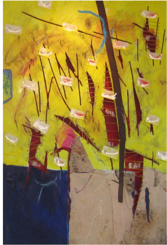
Aus dem Perceval-Zyklus: Wunden Dito, Kunststoffschnüre. Beide 200 x135 cm