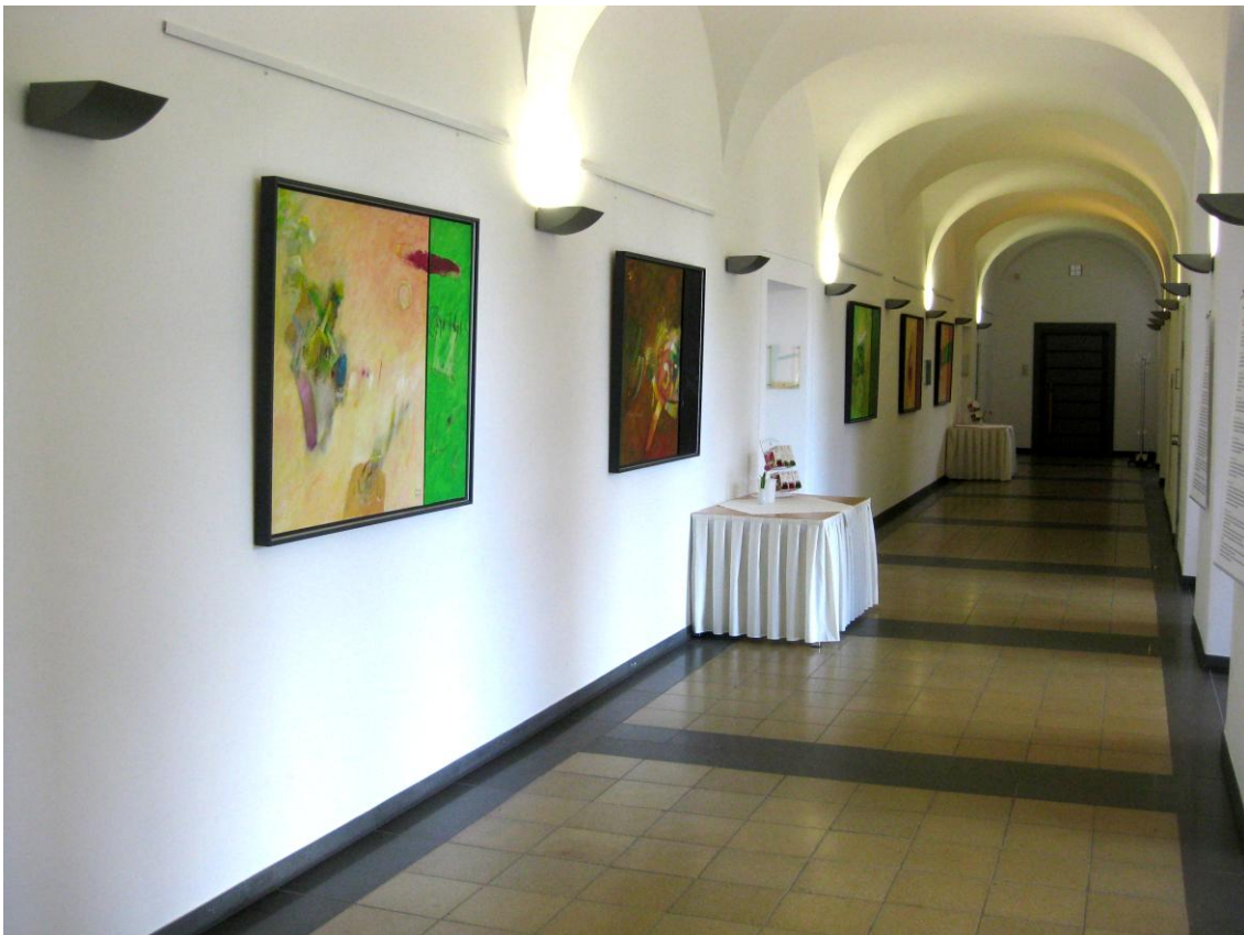
Robert-Schuman-Haus: 10 Vorstudien zum Zyklus: shir: Das Hohelied Alle 105x133cm. Eröffnet am 1. April 2015