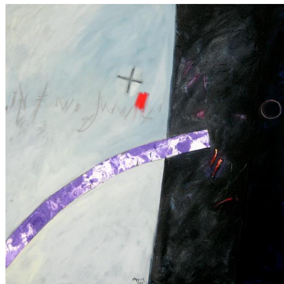
Aus dem Zyklus: Offene Briefe an B.: Tyco Brahe

Exponate von Uwe Appold im Glocken- und Stadtmuseum: