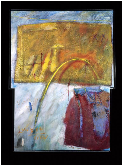
Das erste Kreuz zu den letzten Worten