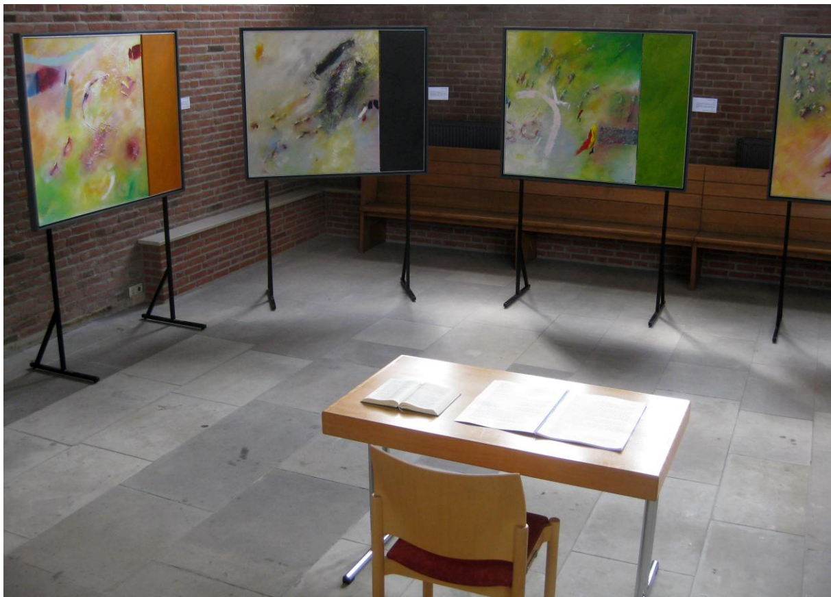
Martin-Luther-Kirche Emden: Präsentation auf Stellagen mit Ausstellungsbegleitbuch