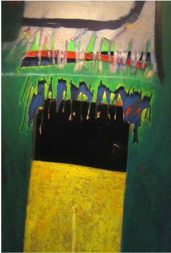
Aus dem Perceval-Zyklus: Samtgelb Acrylfarbe, Textil mit Kettensäge auf Sperrholz.