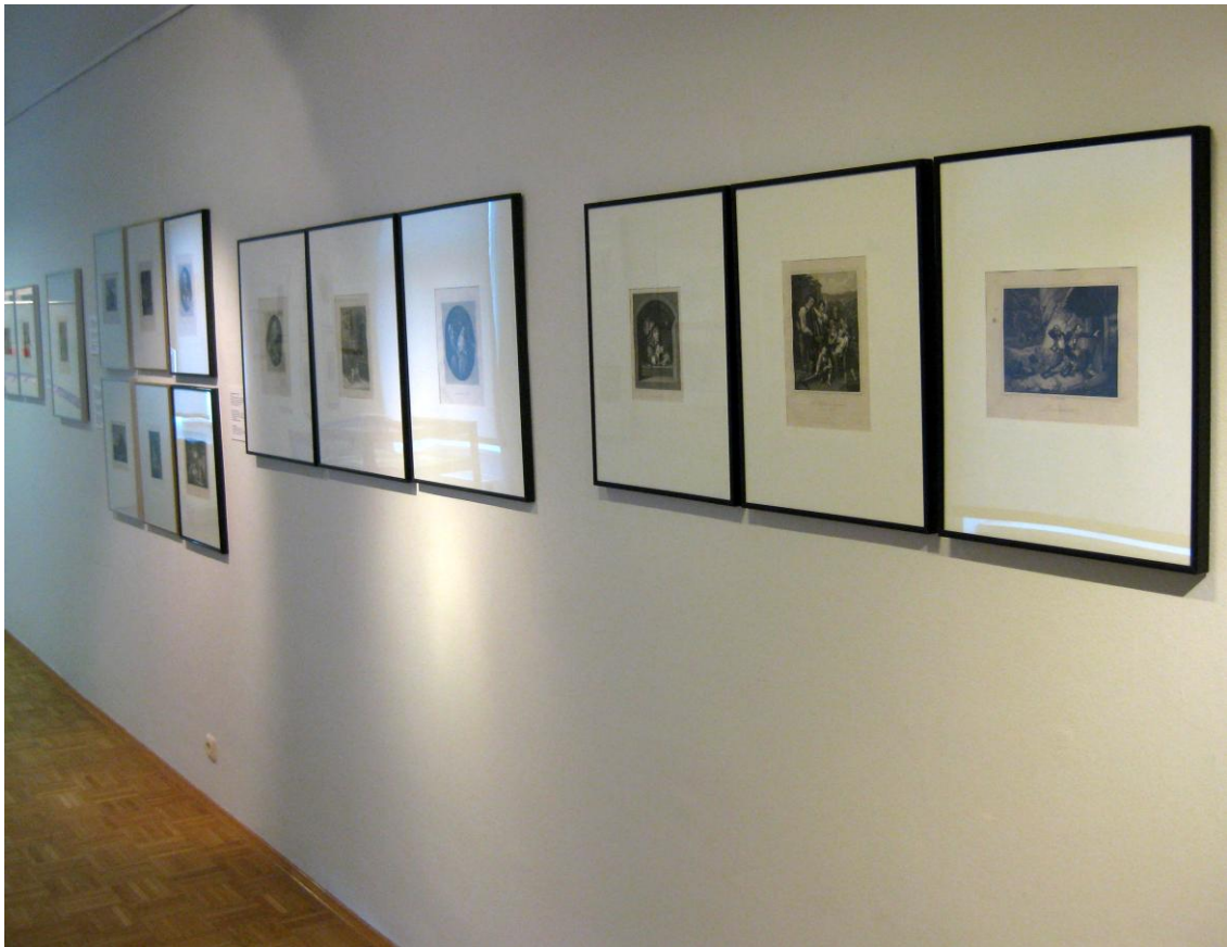
18 Stahlstiche von Johann Leonhard Appold (1809 – 1858). Kleinformate