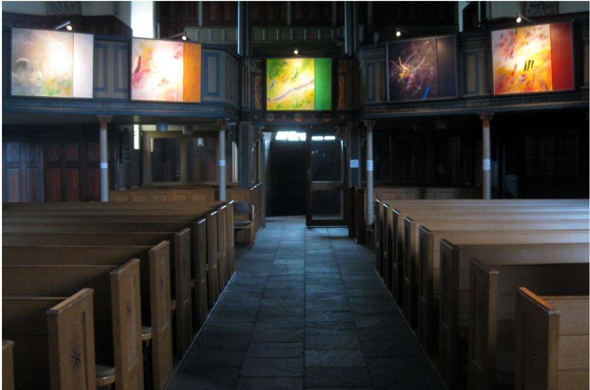
Beispiel Lutherkirche Leer. Einbeziehung der Empore mit Beleuchtung/Fernwirkung