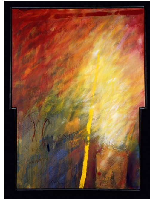
Das siebte Kreuz zu den letzten Worten

Der Bilderzyklus entstand von 1999 – 2000 nach den letzten Worten Jesu am Kreuz zu Golgatha. Die großformatigen Malflächen – 220 x163 cm – zeichnen sich durch eine stark pastos aufgetragene Oberfläche aus, in die teilweise letzte Worte als Engramme eingebunden sind. Neben Acrylfarben und Sand wurden Textilien in Form eines zerrissenen Hemdes auf Leinwand verarbeitet.