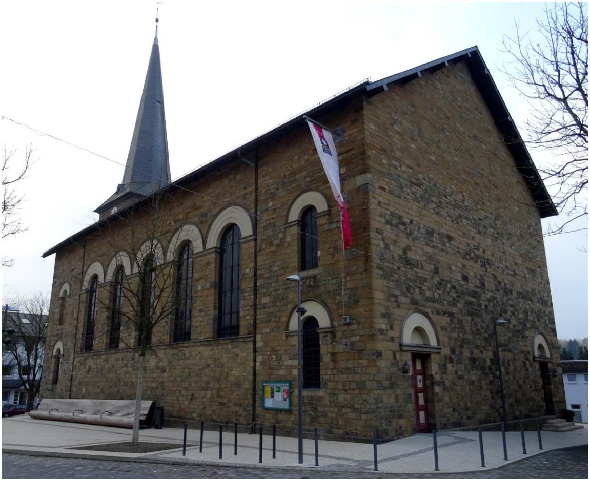
Ev. Kirche in Waldbröl / Oberberg