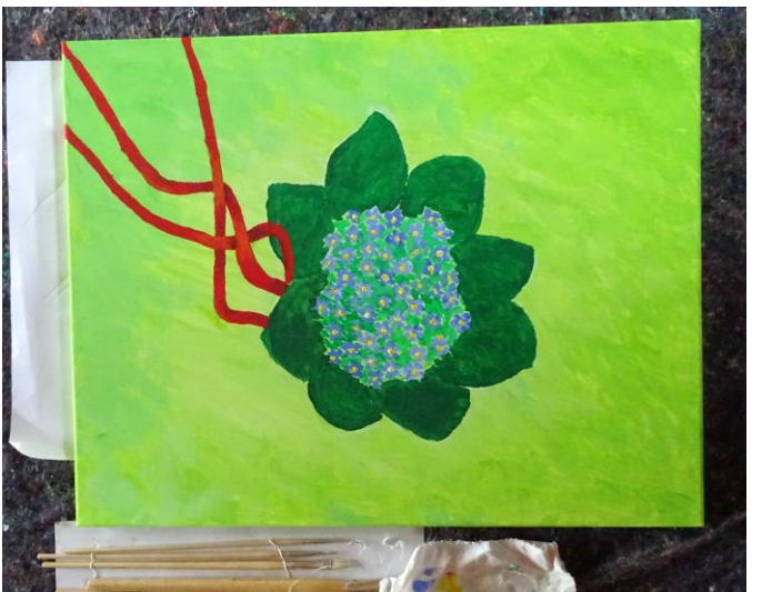
Ergebnisse vom zweiten Tag am 21. 11. 2017