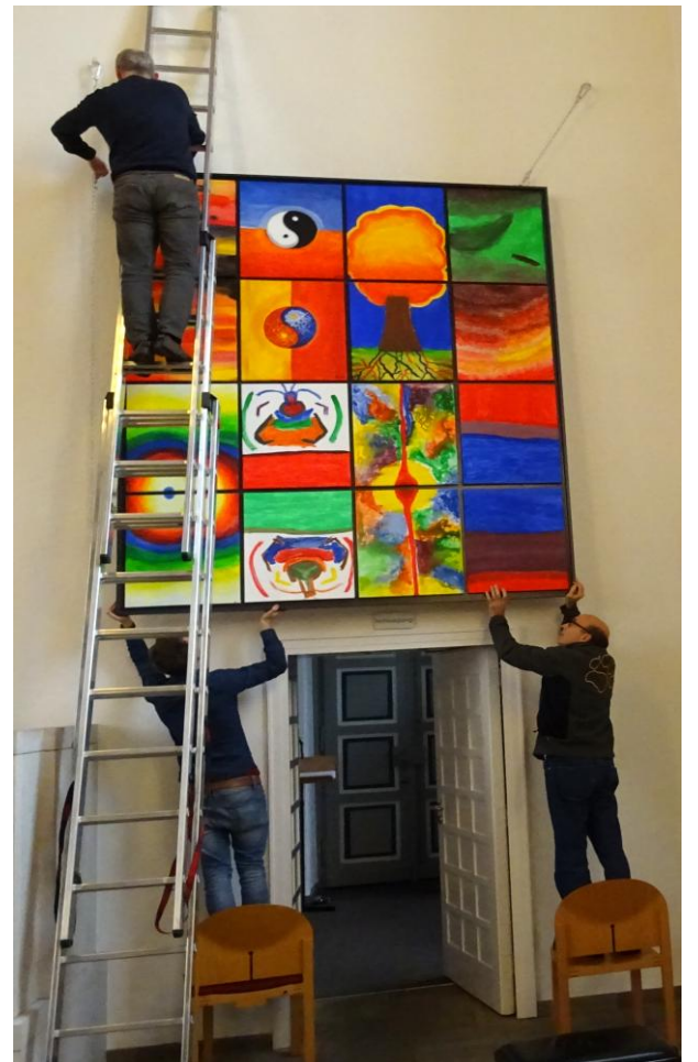
Hängen der Bilder in den Wechselrahmen 2,50 x 2,10 m