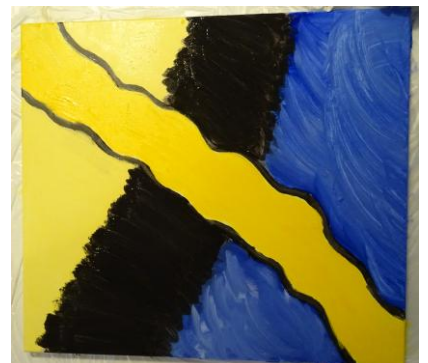
Uwe Appold, 1. Dezember 2017